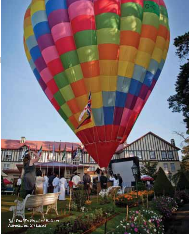
The World's Greatest Balloon Adventures: Sri Lanka

For further information, visit pilotseye.tv