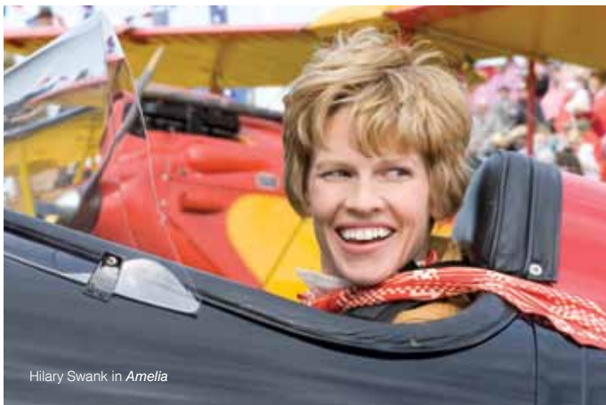
Hilary Swank in Amelia